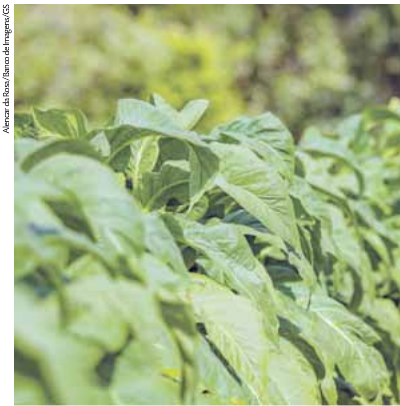
Tabaco mostra a força na geração de empregos nos números do Rio Grande do Sul

O setor de serviços também foi o responsável pelo bom desempenho de outros municípios,